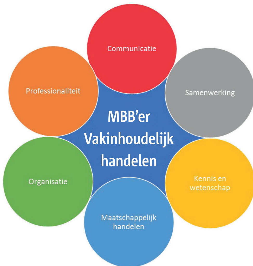
Figuur 2: Competentiegebieden

Elk van de zeven competentiegebieden is uitgewerkt in de volgende onderdelen: